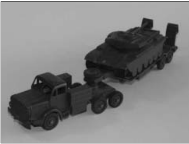
Thornycroft Antar med trailer og Centurion kampvogn fra Dinky Toys – Jeg kan huske at jeg som barn syntes at denne 30 cm lange model var det mest fantastiske man kunne eje, men jeg skulle altså blive 40 inden det skete.