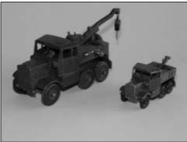
Scammell Explorer i stor model fra Dinky og den lille fra Lesney; -endnu et par køretøjer, der kræver en STOR garage