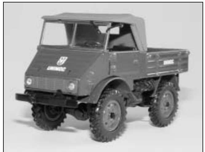
Boevinger UNIMOG fra Minichamps. Den er kun 7,5 cm lang (skala 1/43), men bemærk hvor detaljeret den er. I efteråret 2004, kommer der en GMC CCKW fra samme firma i skala 1/35 og gæt om jeg allerede har bestilt et eksemplar !