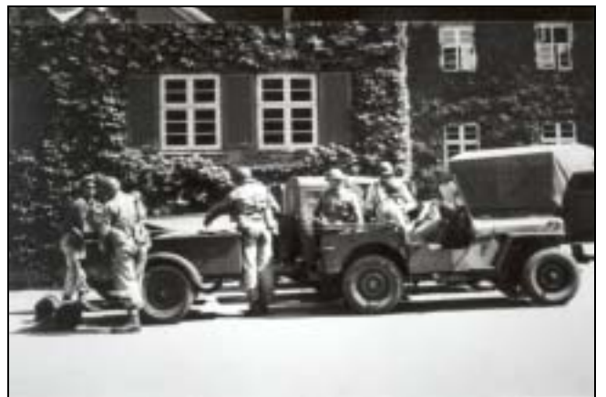
Willys MB eller Ford GPW med Dan/Vestas trailer