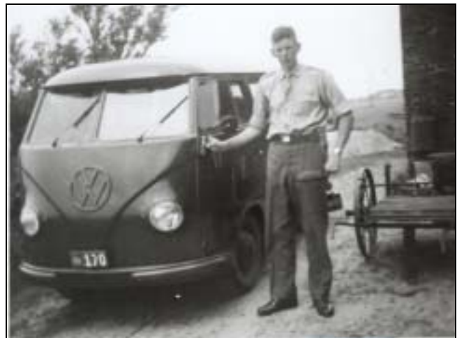
- Og så skal vi ikke glemme, at der også dengang var almindelige civile køretøjer i tjeneste hos Forsvaret