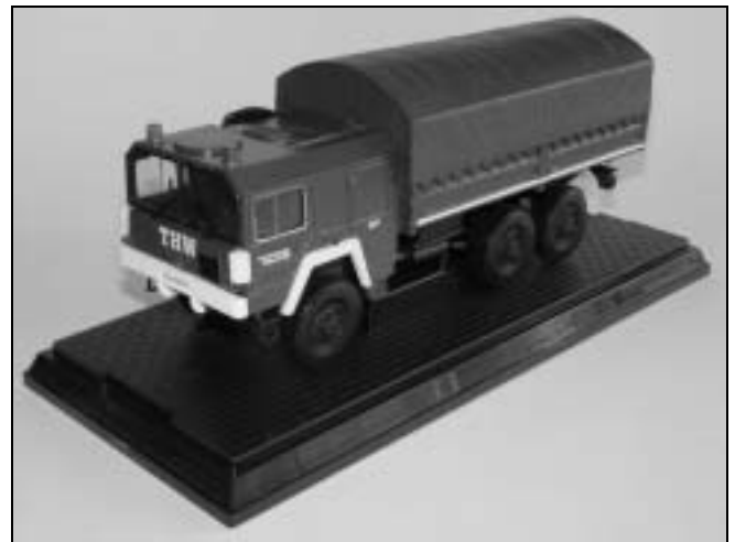
MAN KAT1 6x6 fra Märklin – 27 cm lang, i civil bemaling ganske vist, men jeg har en speciel forkærlighed for MANs terrænkøretøjer af denne type. Da det absolut hører til sjældenhederne, at Märklin laver nutidige bilmodeller i denne skala, måtte jeg bare have den.