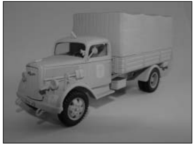
Opel Blitz i tysk Afrikakorps-bemaling fra Vitesse