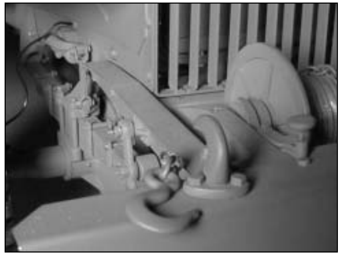
Et par detaljer af Fine Art Models' GMC CCKW

Afslutningsvis kan jeg ikke lade være med at sakse nogle billeder fra Fine Art Models' hjemmeside; - for at vise, hvor detaljeret en færdigmodel til 60.000 kr. er. Dækkene er lidt for blanke, men ellers kunne man da godt tro at ovenstående var den ægte vare ?